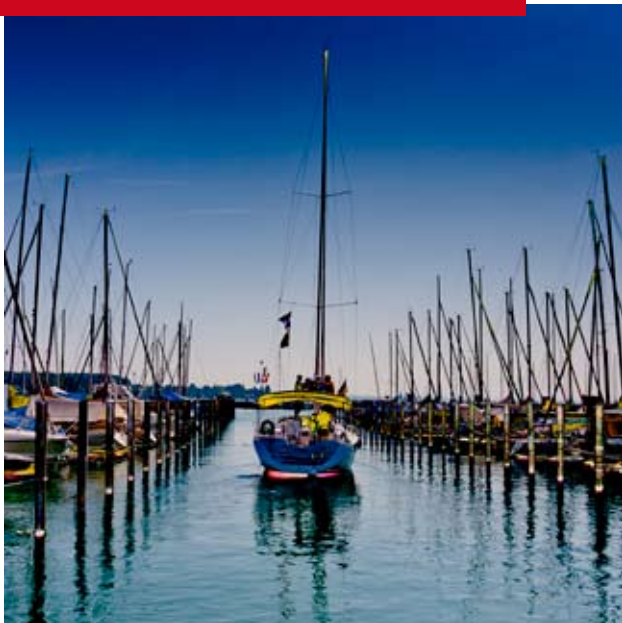
„Leaving Safe Waters“ Foto: James Palik, 2008

Ausstellungseröffnung: The Flexible Negative – Photographic Art by James Palik, Stuttgart