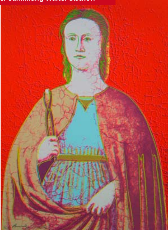
„Saint Apollonia“ by Andy Warhol, 1984

Ausstellungseröffnung: American Pop Art and Beyond – Grafiken aus der Sammlung Walter Bischoff